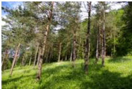
Offener Wald bei Villnachern

Doch nicht nur die Vogelarten in den Landwirtschaftsgebieten sind bedroht. Laut der Vogelwarte zeigen auch die Bestände der Feuchtgebietenbewohner nach wie vor eine negative Entwicklung.