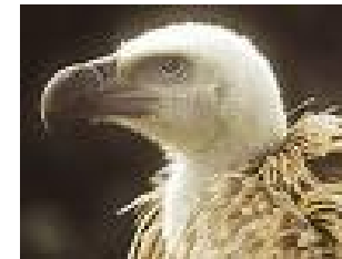
Unter Artenschutz: der Gänsegeier.