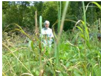
Lunch im Freien