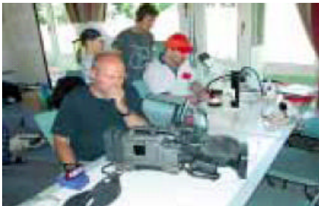
Der Wissenschaftsjournalist bereitet vor Ort die Sendung „Fokus“ für MTW (Menschen- Technik- Wissenschaft) vor. Dieser Beitrag wurde am 3. Juli gesendet.

Basierend auf der Idee des bekannten Biologen E.O. Wilson wird ein ausgewählter Lebensraum während 24 Stunden von vielen Forschern untersucht mit dem Ziel, möglichst viele Tier- und Pflanzenarten zusammen zu tragen.