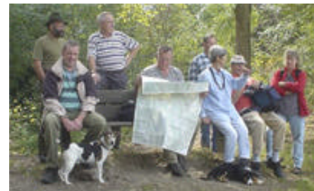
Wer, bitte, kennt den Weg?

Mitgliederbeiträge können an der GV bar bezahlt werden. Vermeiden Sie bitte Einzahlungen durch die Post: die Spesen übersteigen den Betrag, der unserem Verein übrig bleibt.