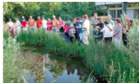
Amphibien und Reptilien gehören normalerweise nicht zu den Tierarten, welche viele Besucher anlocken könnten – doch weit gefehlt.

(Text und Bilder Jürg Matt, Präsident NVV Magden)