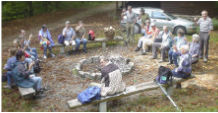
Für das leibliche Wohl wurde gesorgt

Die Herbstwanderung führte uns dieses Jahr in den Eichwald ob Thalheim.