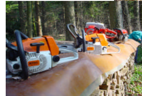
Kleiner Maschinenpark Heute