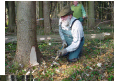
Fällen eines Baumes früher

Gezeigt wurden Holzarbeiten „Einst und Heute“. Die Bilder sollen einen kleinen Eindruck dessen vermitteln, wie das Arbeitsumfeld und die Arbeitsmethodik sich in den letzten 50 Jahren verändert haben.